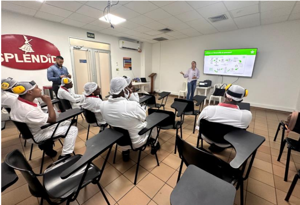
b) Evaluación presencial del instrumento de conocimiento, desempeño y producto, a los candidatos de la empresa Colombina del Cauca, en la norma 290801113 v_1 Controlar proceso de producción de alimentos según orden de producción y normativa de calidad.